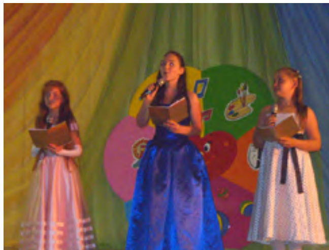
Ведущие открытия - учащиеся театральной студии «Импровиз» ДДТ «Октябрьский»