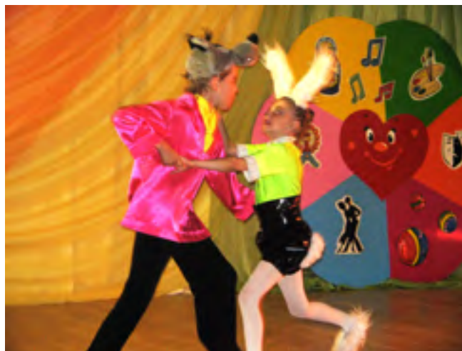
Ансамбль «Задоринки» выступил с танцем «Ну, погоди!»

предложили всем присутствующим в зале создать свой сказочный сад доброты. Оказывается, для этого нужно обладать и владеть в совершенстве такими качествами, как добротой, доверием и любовью. А для того, чтобы ухаживать за своим садиком и как следует согреть его нужно много-много солнца. Песню «Солнечная капель» исполнила самая юная участница открытия