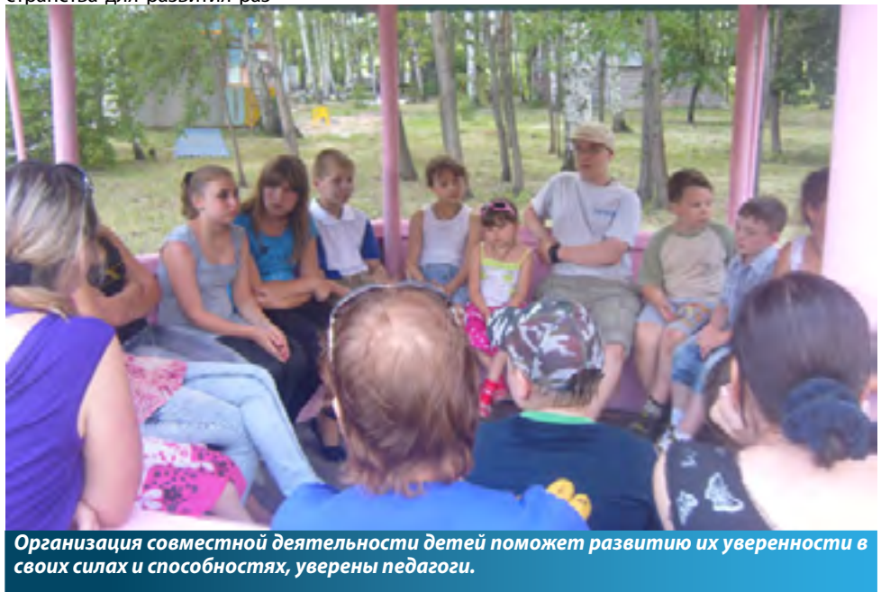
Организация совместной деятельности детей поможет развитию их уверенности в своих силах и способностях, уверены педагоги.